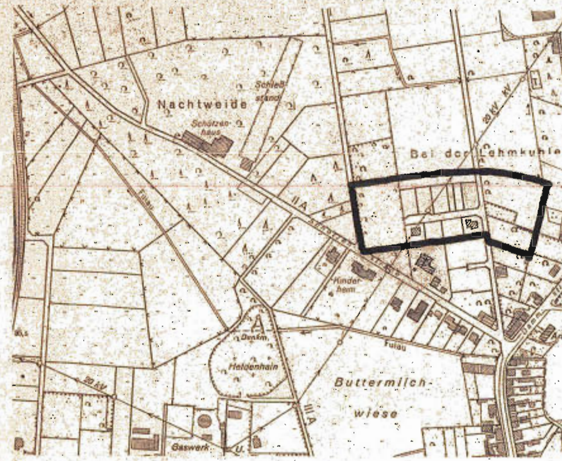
Übersichtskarte M. 1:5000

Weitere Vervielfältigungen aller Art sind nicht gestattet!