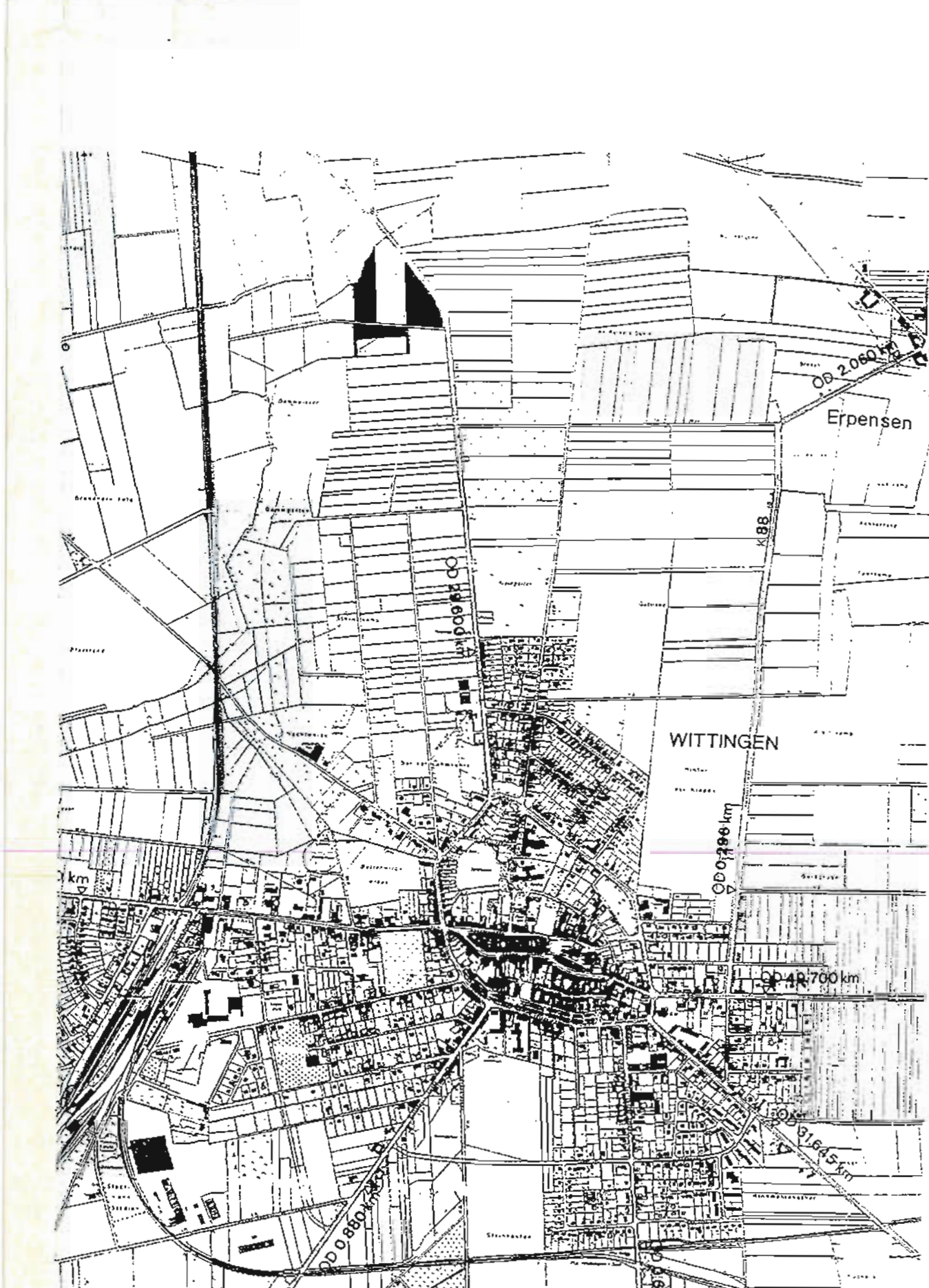
- Lage der Ausgleichsfläche für den Bebauungsplan „Gewerbegebiet Celler Straße“, Stadt Wittingen