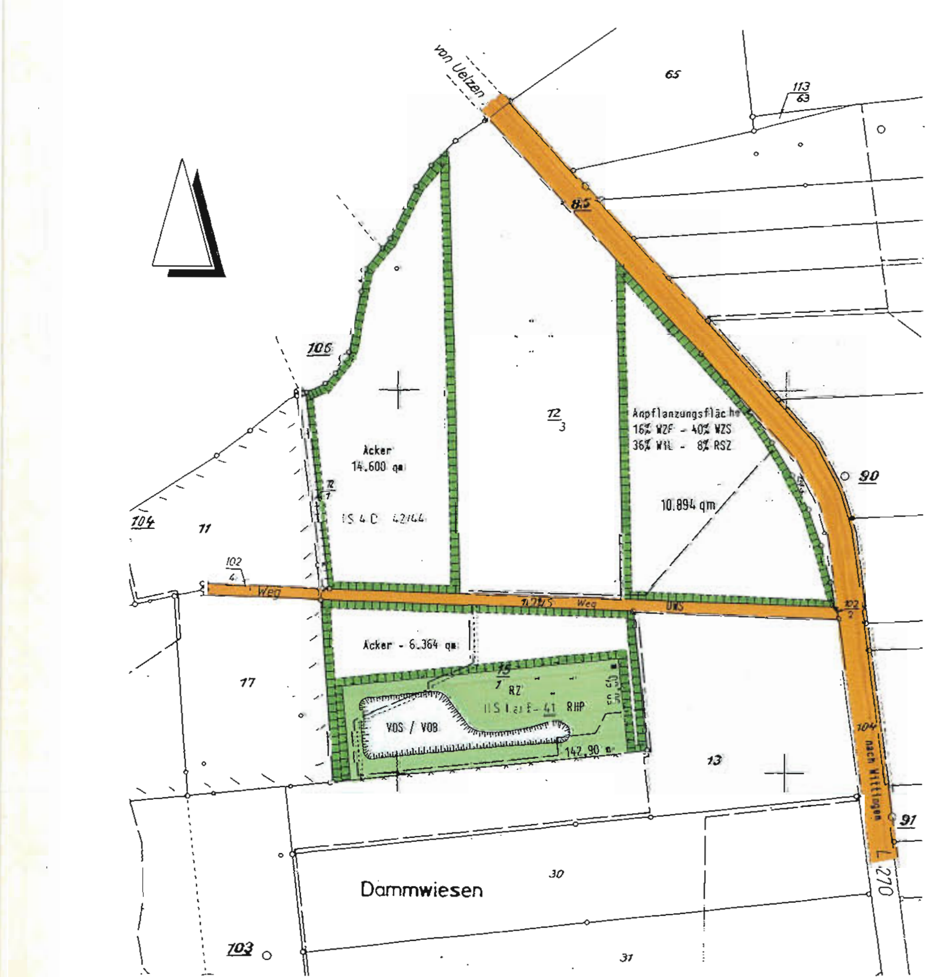
PLAN GELTUNGSBEREICH „B“